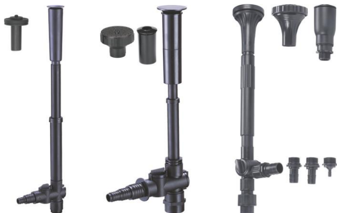
Suutinsarja 2000 / Suutinsarja / Fontänset 2000 Suutinsarja 3000/4000 Suutinsarja 5000 Fontänset 3000/4000 Fontänset 5000