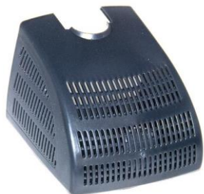
Suodatinkotelo / Filterkåpa