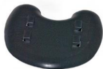
Jalusta / Fot