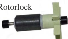
Roottori / Rotor