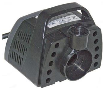
Pumppupesä / Pumphus