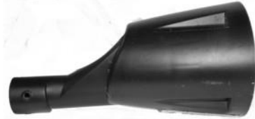
Sort beskytelseskappe. Musta suojakotelo