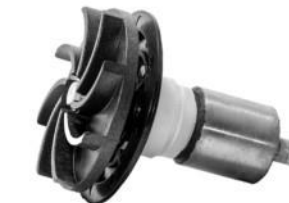
Rotor / Roottori