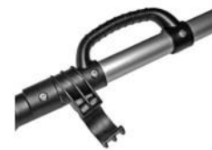
Bærehåndtag og slangeholder. Kantokahva ja letkupidike