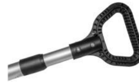
Håndtag / Kahva