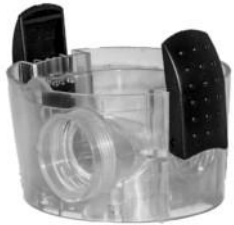
Rotorhus med 2 klemhager. Roottoripesä kahdella kiinnikkeellä