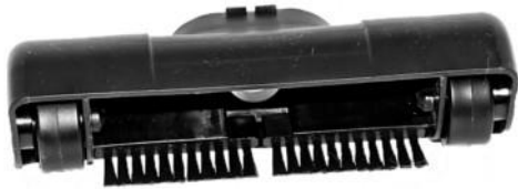
23 cm suulake pyörillä 23 cm suulake pyörillä