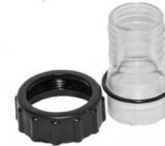
Slangenippel med om- løber og o-ring. Letkuliitin lukkorenkaalla ja O-renkaalla