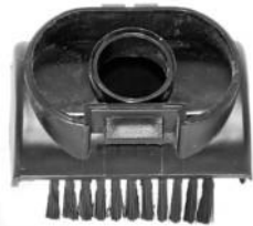
10 cm mundstykke. 10 cm suulake