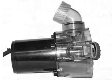
Pumpehoved med rotorhus og vinkelnipl. Pumpunpää, roottoripesä ja kulmaliitin