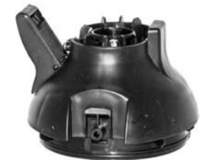
Rotorlåg m. klemhage Roottorinkansi kiinnikkeineen