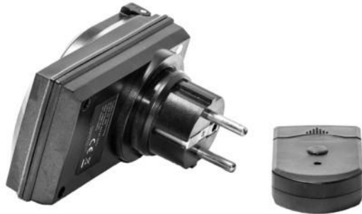
Tænd/sluk fernkontrol og modtager Kaukosäädin (päälle/pois) ja vastaanotin