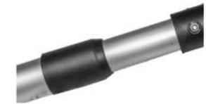
Låseskrue til teleskopfunktion. Teleskooppiputken lukitusruuvi