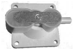
Ilmakammio AN1680 / luftkammare AN1680 Tuotenro/Artnr. 30635 12