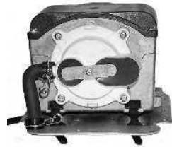
Pumppulohko pyöreällä ilma- kammiolla / Pumpblock med rund luftkammare