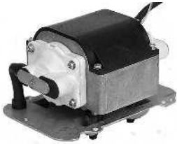
Pumppulohko nelikulmaisella ilmakammiolla / Pumpblock med fyrkantig luftkam- mare