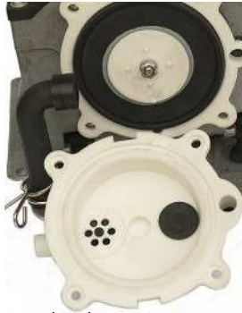
Ilmakammion kansi irrotettuna / Luftkammarens lock monteras bort