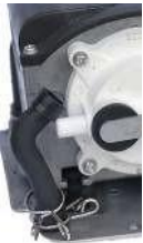
Ilmakammion ilmaletku irrotettuna / Luftslangen i luftkam- maren monteras bort