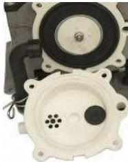
Ilmakammion kansi irrotettuna / Luftkammarens lock monteras bort