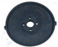
Kalvo, jossa on reiät asennuslevyn tapeille / Membran med hål för monteringsplattans stift.