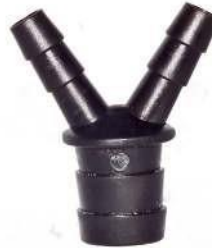
Letkuliitin mallille AN3000 ja AN4200 Slangkoppling till modell AN3000 och AN4200