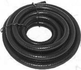
Musta ilmaletku tuotenro 50545 (9 mm x 100 m) Svart luftslang artnr. 50545 (9mm x 100 m)