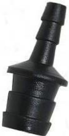
Letkuliitin mallille AN1680 Slangkoppling till modell AN1680