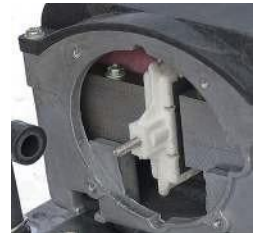
Kalvopidikkeen akseli / Membranhållarens axel