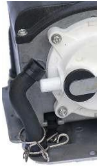
Ilmaletku irrotettuna / Luftslangen i luftkammaren monteras bort