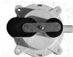
Ilmakammio AN3000 / luftkammare AN3000 Tuotenro/Artnr. 30636