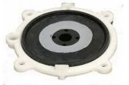
Kalvopidike, nailonttiiviste ja kalvo / Membranhållare med nylonpackning och membran.