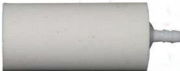
Suuri lieriömäinen hapetin tuotenro 30650 Stor cylinderformad luftsten artnr. 30650