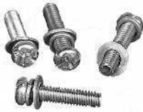
Ilmakammion ruuvit, aluslevyt ja lukkorenkoot Skrubar till luftkammaren med brickor och låsringar