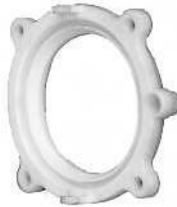
Kalvopidike / Tom membranhållare