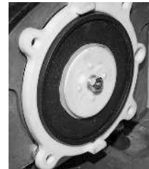
Kalvopidike akselille asennettuna / Membranhållare mon- terad på axeln