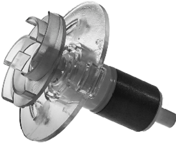
Rotor Superflow Techno 3500LV Art.nr. 31332