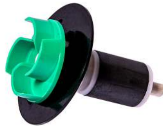
Rotor Superflow Techno 20000LV Art.nr. 31336