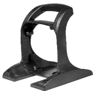
Håndtag / Handtag 3500 / 6500 Art.nr. 30934 12000 + 20000 Art.nr. 30935