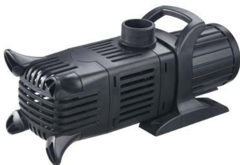
Pumpe med fødder for lodret montering Pump med fötter för vertikal montering