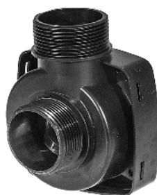
Rotorlåg / Rotorlock 3500 / 6500 Art.nr. 31338 12000 + 20000 Art.nr. 31340