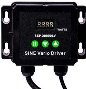
Kontrolboks / Kontrolbox Superflow Techno 20000LV Art.nr. 30965