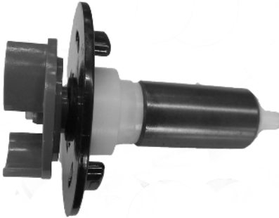
Rotor Superflow Techno 12000LV Art.nr. 31334