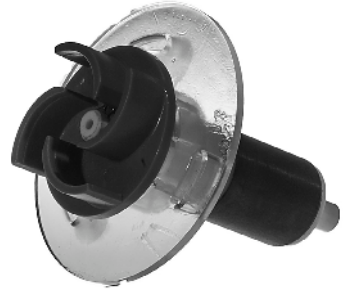
Rotor Superflow Techno 6500LV Art.nr. 31333